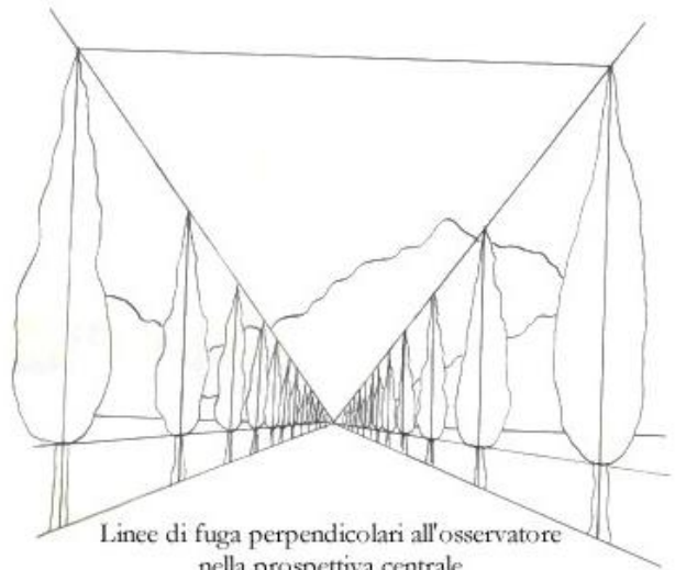
Linee di fuga perpendicolari all'osservatore nella prospettiva centrale